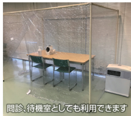
問診、待機室としても利用できます