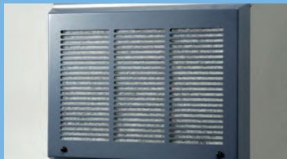
空気清浄フィルター

オゾンによるくん蒸は、お部屋の隅々までキレイに臭いを消します。さらに触媒と脱臭フィルターのトリプル効果で脅威の脱臭効果を実現。またオゾンは除菌効果も発揮します。