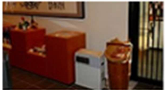
▶ 稲武工場売店 (eZ-100)