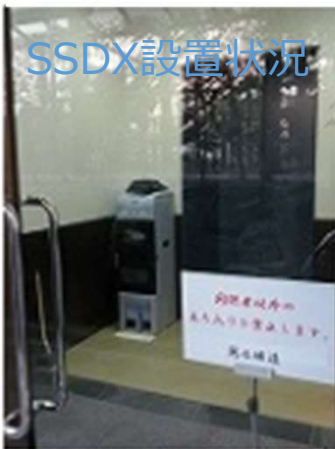
▶ 本社工場入口 (SSDX)