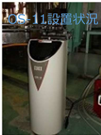
▶ 本社工場 (OS-11)