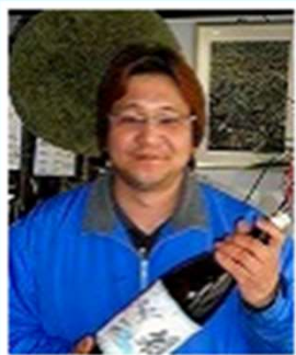
関谷醸造株式会社様 (愛知県北設楽郡設楽町)