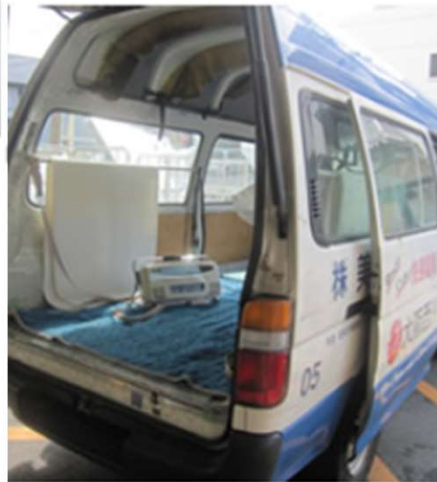
▶ 運搬車 (OUD-1)