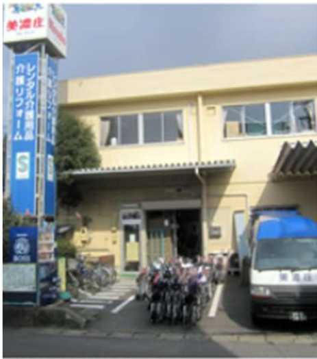
▶ 株式会社美濃庄様