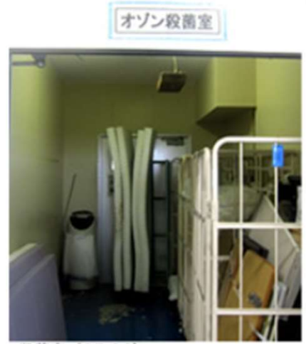
▶ 殺菌室 (OP-10)